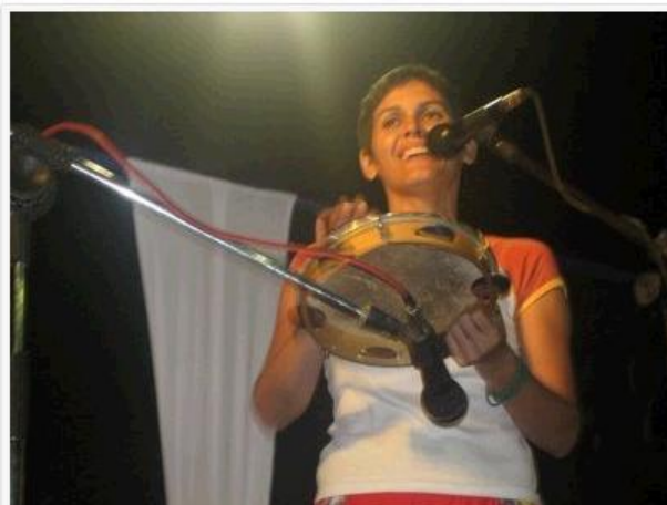
Poeta e atriz Lília Diniz