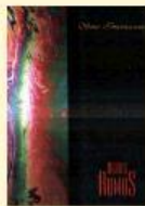
Novos Rumos - 2000